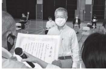
優良団体 バスケットボール協会