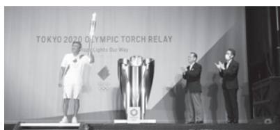
オリンピック聖火点火式

パラリンピック聖火リレーは、8月20日子ども未来センターで採火式、8月22日国分寺市のセレブレーション会場で点火式が行われ、20名のランナーがトーチキスで聖火をつなぎました。