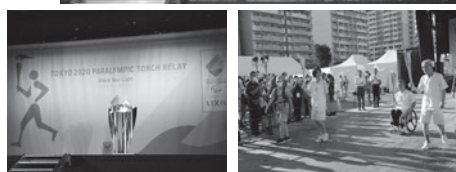
パラリンピック聖火点火式